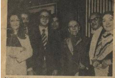
ALIRIO DIAZ'IN RESITALI

1969 yıllarında gitar eğitimcisi olarak çok yoğun çalıştığı dönemlerde bugünün önemli gitaristleri kendisinin öğrencisi oldu. O dönemlerde sayısız öğrencisi ile çok meşgul olan Arslanyan'a Çemberlitaş'taki Belediye Konservatuarı'nın gitar bölümünü açması için teklif edildi. O dönemlerde solo bir enstrüman olarak dünyada yeni yeni kabul gören gitarın konservatuara girmesi teklifini Arslanyan öğrencilerinin yoğunluğu sebebiyle reddetti.